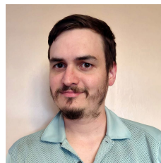
Marco Moreno Diseño multimedia